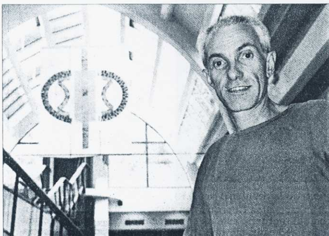
Pascal Coudret a créé une œuvre gigantesque, tout spécialement pour le cadre de la Bibliothèque municipale de Saintes

Natif de Saintes, Pascal Coudret expose pour la première fois à la bibliothèque municipale. Un travail pictural inspiré de la typographie